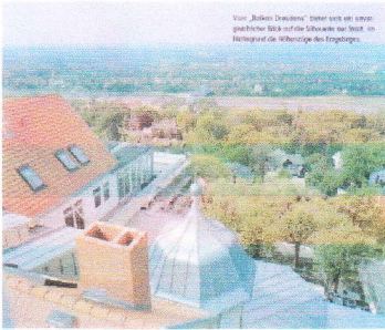
Luisenhof Dresden Zink-Stehfalz