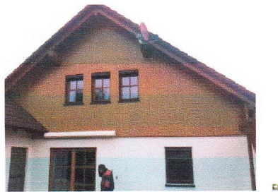
Fassadenverkleidung mit Aluminium Holzoptik